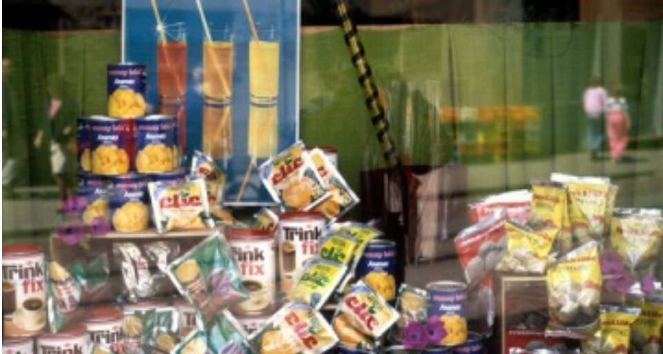
Das Schaufenster eines "Delikat"-Ladens in Bad Doberan, 1988.

Die Führungselite der SED, die ihre Alleinherrschaft im Zuge der Stalinisierung der DDR in den Jahren 1948/49 durchgesetzt hatte, strebte bereits seit 1945 nach einer umfassenden wirtschaftlichen und gesellschaftlichen Umwälzung.