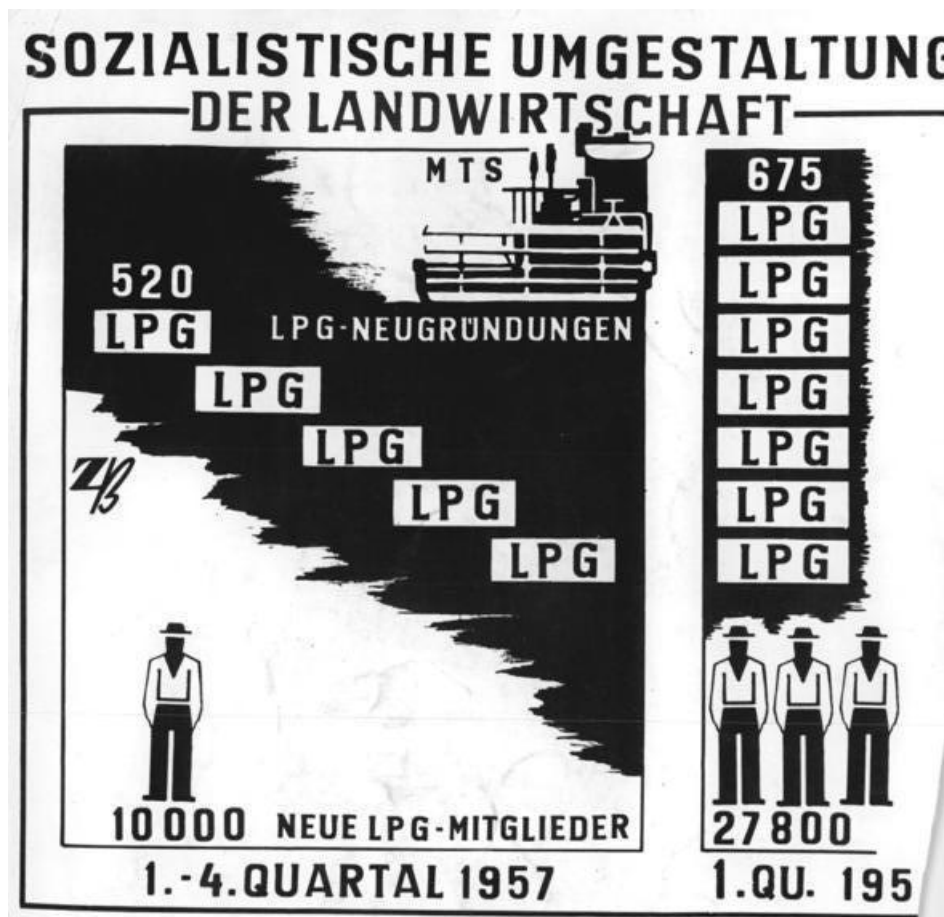
Bildunterschrift: 1958. Die Genossenschaftsbewegung in der Landwirtschaft hat in diesem Jahr einen großen Aufschwung genommen. Im 1. Quartal 1958 bildeten sich 75 neue LPG und die Zahl der Mitglieder wuchs um 27 800."