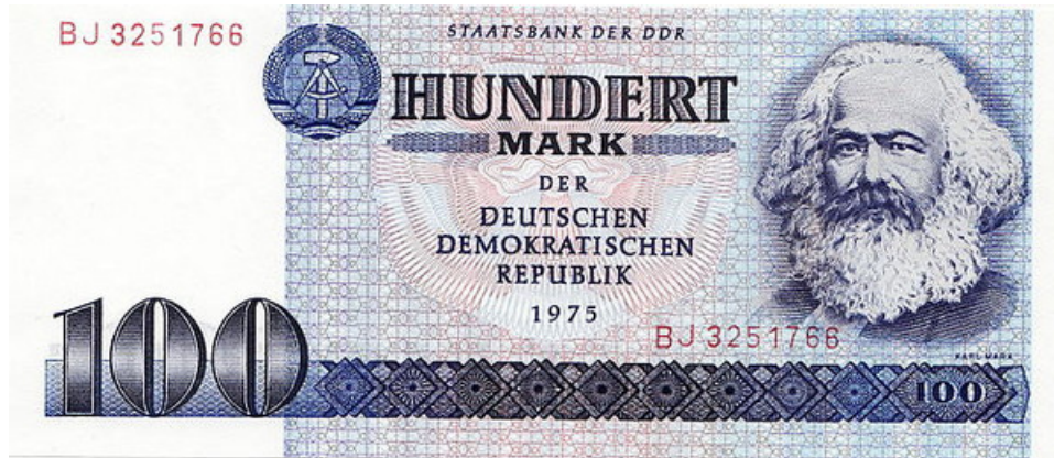
100 Mark-Schein der DDR, 1975.

In der DDR zahlte man mit Mark und Pfennig. Eine Übersicht über alle Geldscheine und Münzen bietet Wikipedia ( https://de.wikipedia.org/wiki/Mark_(DDR) ).