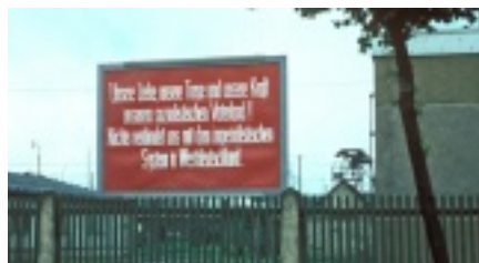
„Unsere Liebe, unsere Treue und unsere Kraft unserem sozialistischen Vaterland! Nichts verbindet uns mit dem imperialistischen System in Westdeutschland“. DDR Parteireklame 1972.

Sein vorläufiges Ende fand der innerdeutsche Ost-West-Konflikt mit der Öffnung der innerdeutschen Grenze und dem Fall der Mauer im Herbst 1989.