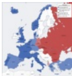
Ein Klick auf das Bild führt Sie zum Fotoalbum