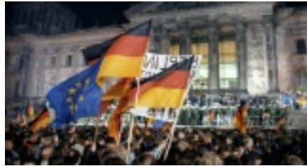
Feier zur Deutschen Einheit in der Nacht zum 3.10.1990 in Berlin vor dem Reichstagsgebäude.