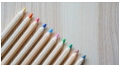
Ein Klick auf das Bild führt Sie zur Großansicht

(/fileadmin/ddr-im-unterricht/images/jugendkultur_gr.png)