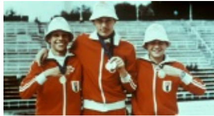
Rolle des Sports in der DDR (Selbstdarstellung in der Propaganda).

Sport hatte in der DDR einen sehr hohen Stellenwert, er erfuhr sowohl in der Bevölkerung als auch in Regierungskreisen eine immense Wertschätzung. Die Führungselite der DDR sah sich von Beginn an in der Tradition der früheren Arbeitersportbewegung. Aufgrund dessen wurde primär der Breiten- und Massensport gefördert. So war die 1958 von Walter Ulbricht ausgegebene Losung kaum verwunderlich: