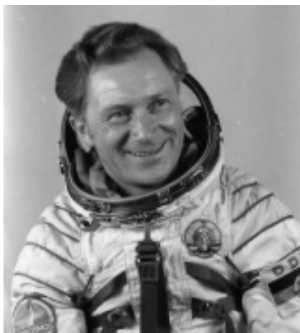
"Oberstleutnant Sigmund Jähn gehört als Forschungskosmonaut zur Besatzung des Raumschiffes Sojus 31, das am 26.8.78 in der Sowjetunion gestartet wurde."

Sigmund Werner Paul Jähn ist der erste Deutsche im Weltraum