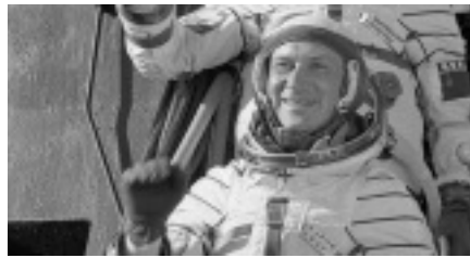
"Vor dem Start winken die Kosmonauten ein letztes Mal zurück."

Der Flug, dessen Kosten sich auf 82 Millionen DDR-Mark beliefen, war der DDR-Regierung in doppelter Hinsicht hilfreich. Die Erkundungsreise ins Weltall, die Jähn mit seinem Team zur sowjetischen Raumstation Saljut 6 unternahm, brachte einerseits eine willkommene Belebung für die DDR-Propaganda. Die technischen Experimente mit der Multispektralkamera „MKF 6 Erke“ brachten zudem wichtige wissenschaftliche Erkenntnisse, beispielsweise zur Erdfernerkundung und für die medizinische Forschung.