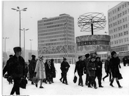
Weltzeituhr auf dem Alexanderplatz im Winter 1969.

Elektrotechnik und Elektronik waren unlängst zu den Lieblingskindern der DDR-Führung geworden. Der „Wettlauf mit der Zeit“ wollte gewonnen werden. Dies implizierte die Entwicklung einer computergestützten Produktion und der damit verbundenen Rationalisierung bzw. Steigerung von Produktionsmengen. Überdies erhoffte sich das DDR-Regime dadurch eine gesteigerte Konkurrenzfähigkeit von DDR-Produkten auf dem Weltmarkt. Es kann somit kaum verwundern, dass die DDR-Elite im elektronischen Wirtschaftssektor einen besonders großen Ehrgeiz entwickelte.