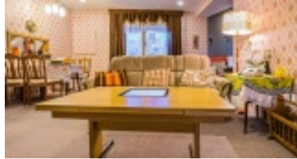
Originalgetreues DDR-Wohnzimmer.