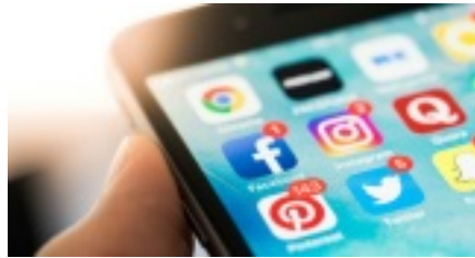
Social Media App Icons auf einem Smartphone.